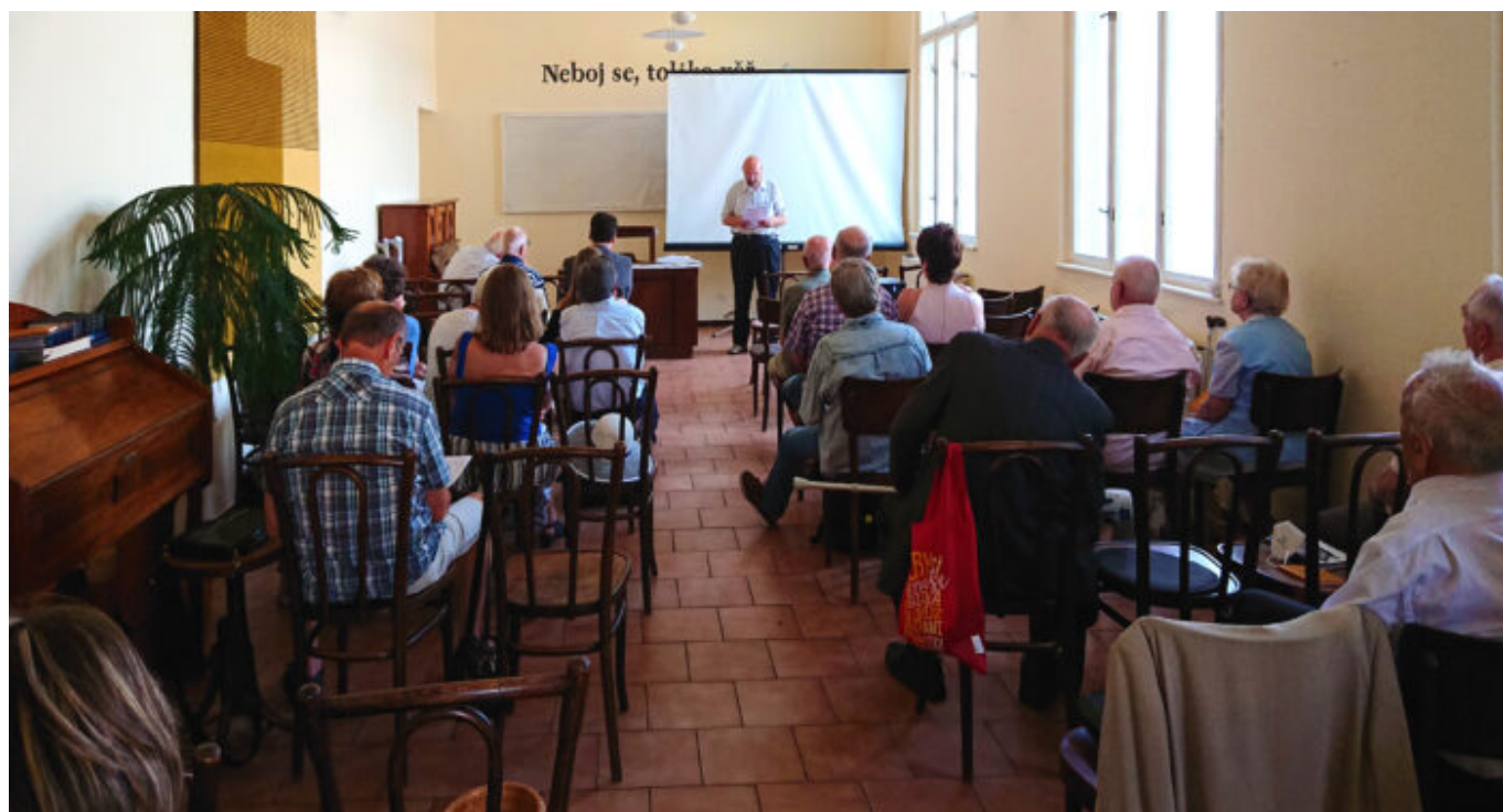
Konference spolku EXULANT v modlitebně Baptistického sboru Na Topolce