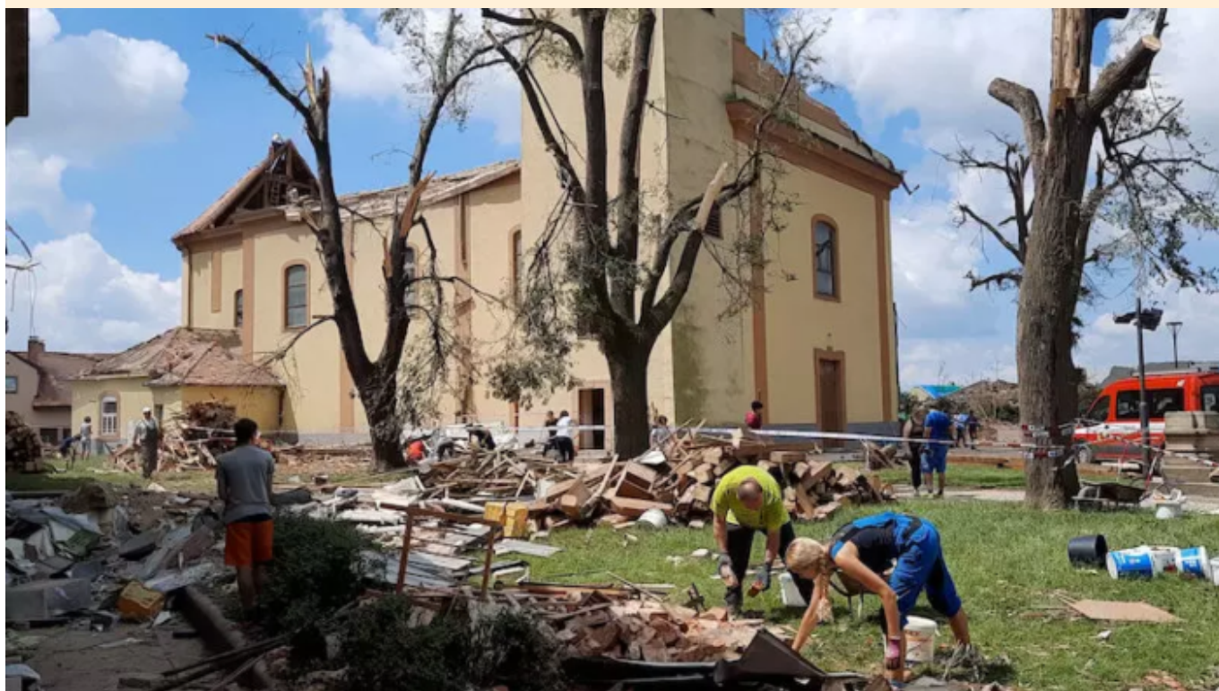
Moravská Nová Ves v těchto dnech

V Moravské Nové Vsi jsme připraveni pomoci s úklidem a zamýšlený program zredukovat.