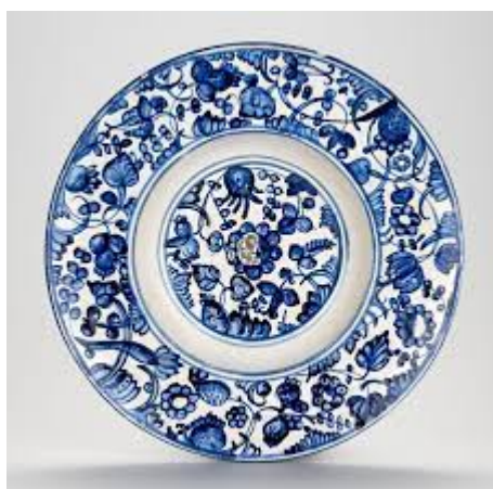
Habánská keramika - fajáns