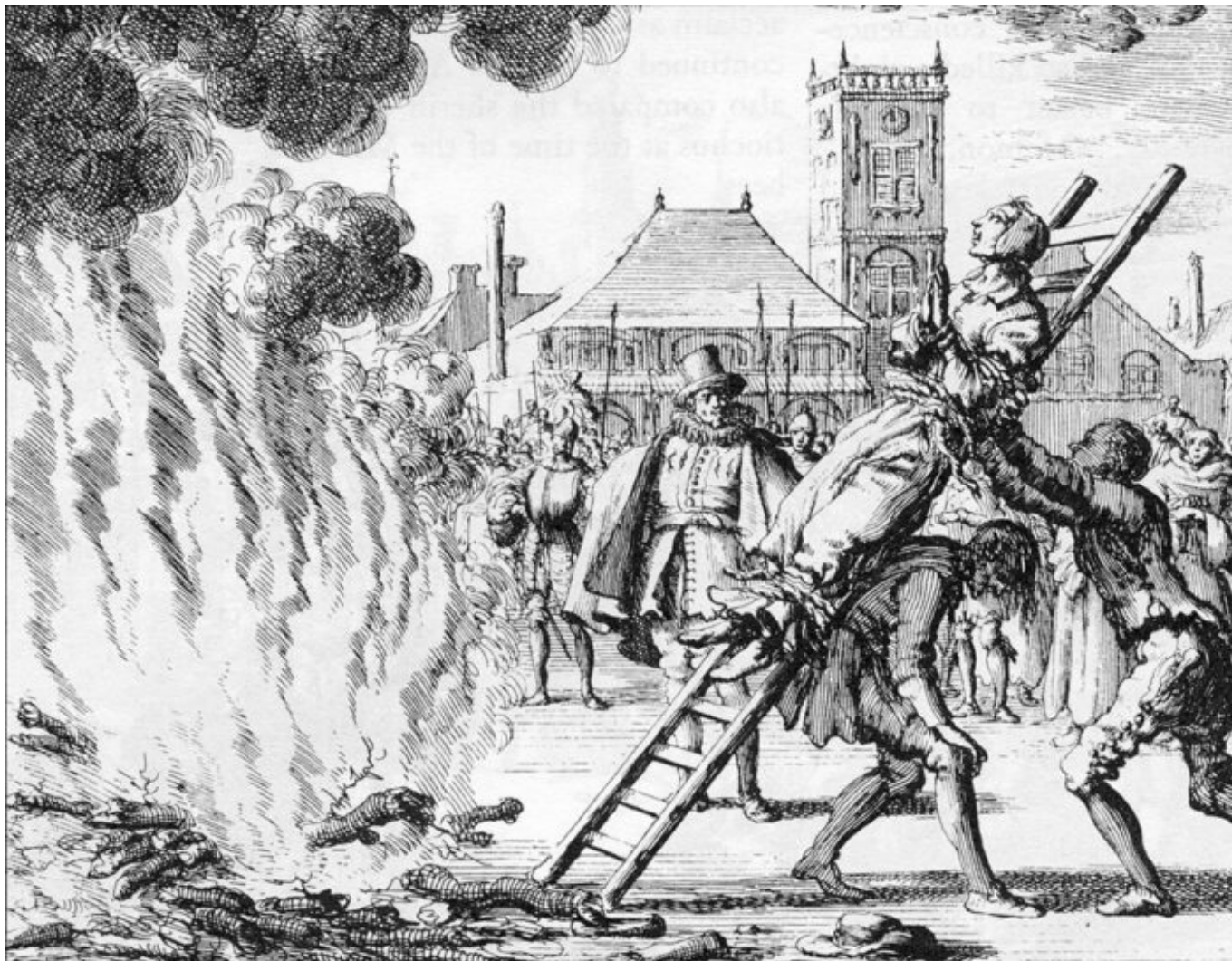
Upalování novokřtěnců na hranici (Anneken Hendriks, † 1571)