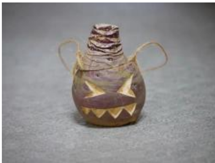
Tuín jako halloweenská lampa

Halloweenské lucerny (Jack-o'-lanterns) vznikly o něco později, když se Halloween dostal do Severní Ameriky. Irští katolíci ve Spojených státech spojili lidovou tradici s náboženskou historií tohoto svátku.