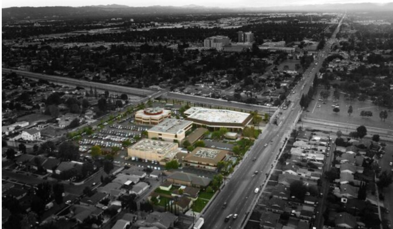
Letecký pohled na Grace Church v jižní Kalifornii

Ale konečném důsledku, i když mezi konzervativními evangelikály budou různé druhy přesvědčení, realita je taková, že jejich sdílená víra ve věčné vědomé trápení bližních poslouží pouze k vytvoření různých odstínů ztracené lidskosti.