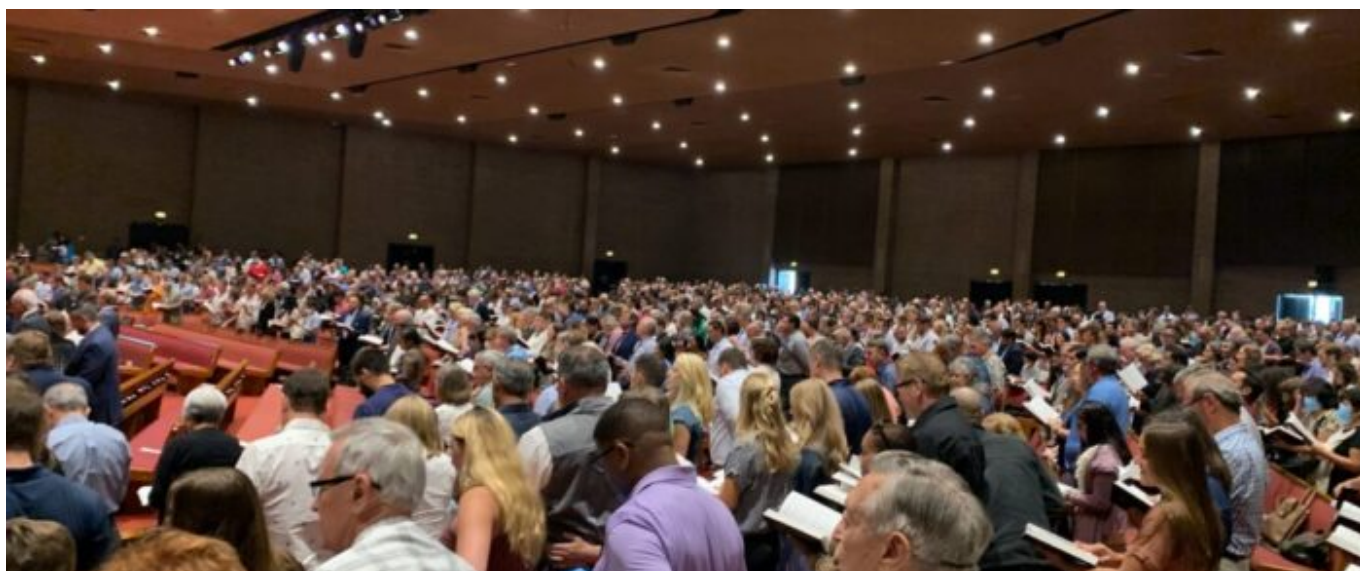
Shromáždění ve sboru Grace Church v době pandemických opatření