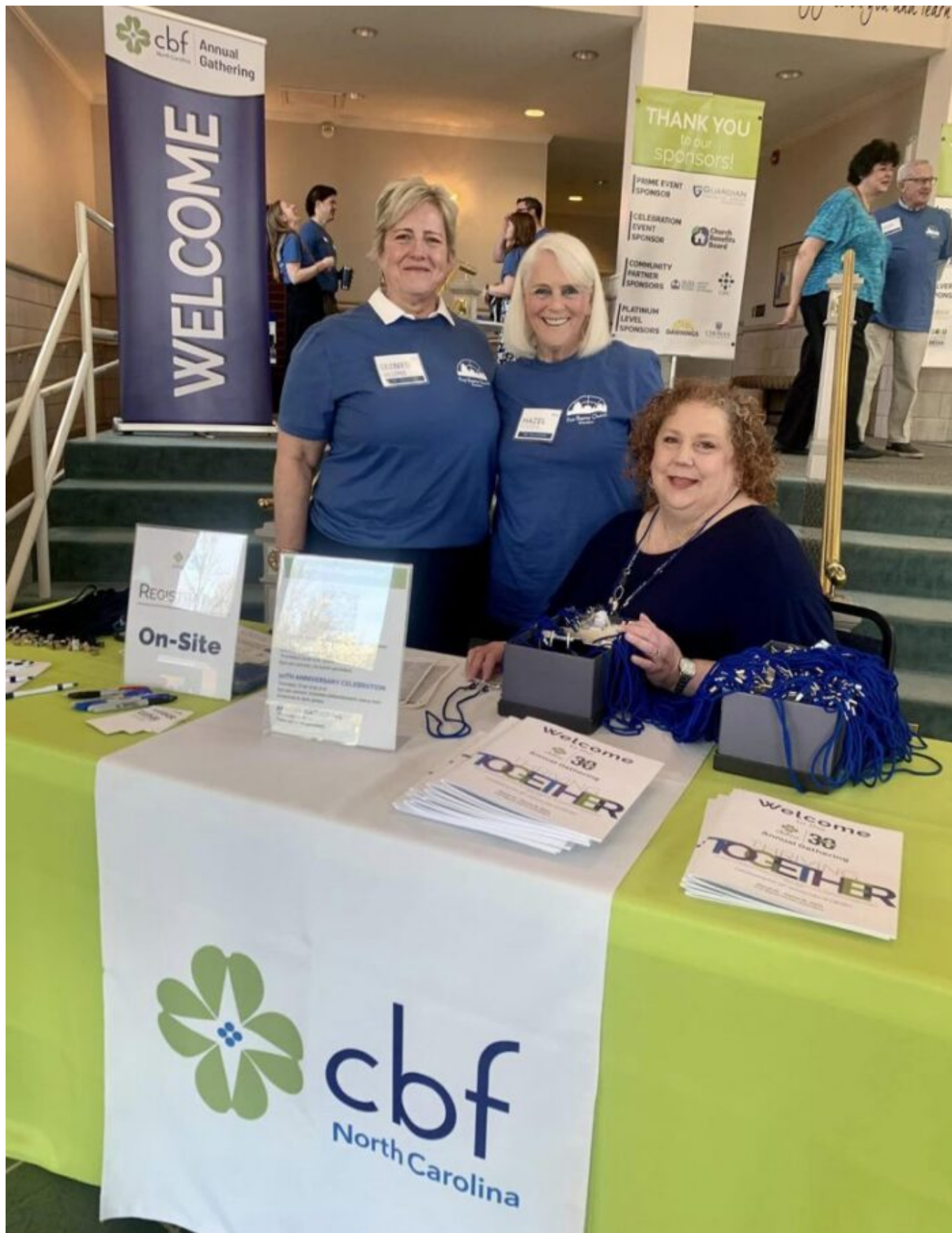
Dobrovolníci a zaměstnanci se připravují na přivítání účastníků ve First Baptist Church of Greensboro.

Od počátku žádný stát nezaznamenal v tomto úsilí větší úspěch než Severní Karolína. A dnes je Cooperative Baptist Fellowship of North Carolina zdaleka největší a nejlépe financovanou státní či regionální organizací v životě CBF. Zaměstnává 12 pracovníků a podporuje tučet univerzitních