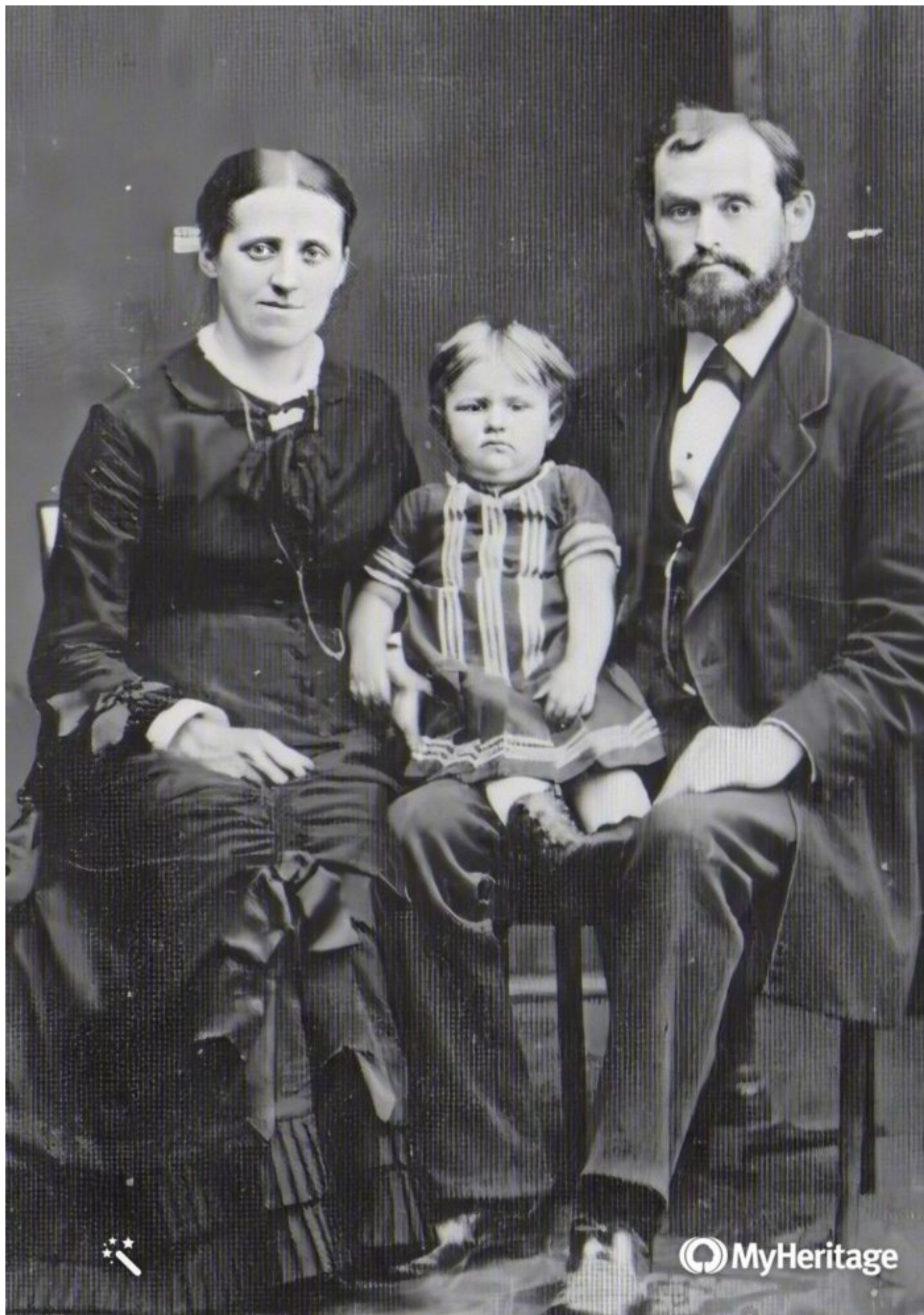
Manželský pár s dcerou