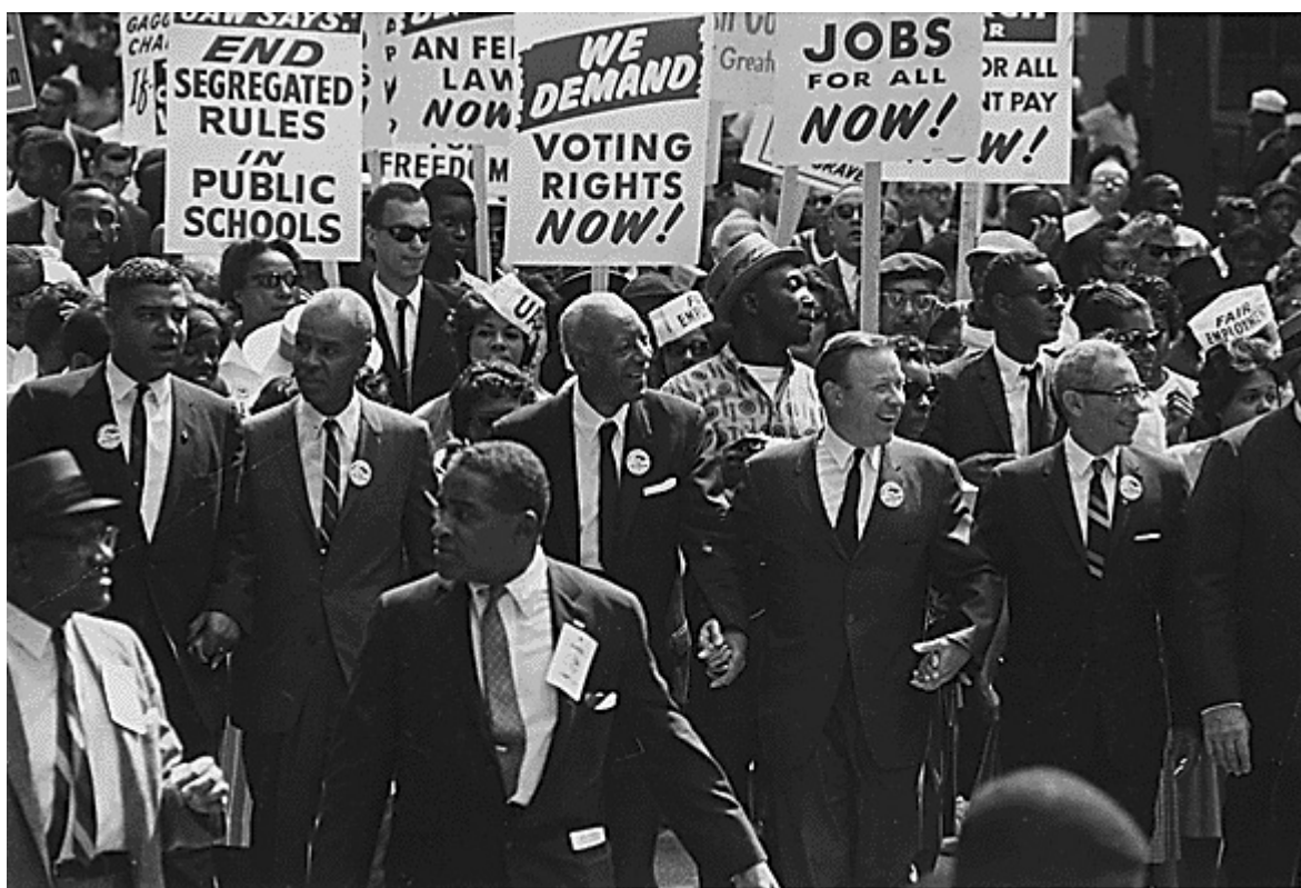
Z pochodu za občanská práva na Washington v roce 1963.

Jiní tuto větu z Kingova projevu zneužívají k tomu, aby řekli, že by byl proti pozitivním opatřením a že věřil, že aby se lidé v Americe “prosadili”, musí se prostě sami “vytáhnout za vlastní boty” (pomoci si sami vlastními silami). To je zjevná lež.