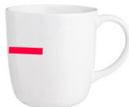
míra půl šálku