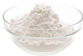
prášek do pečiva