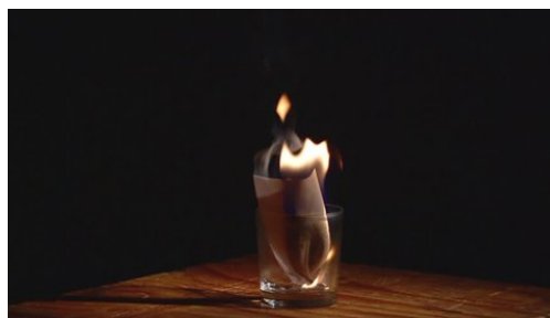
flash papír vzplane