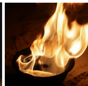
flash papír hoří