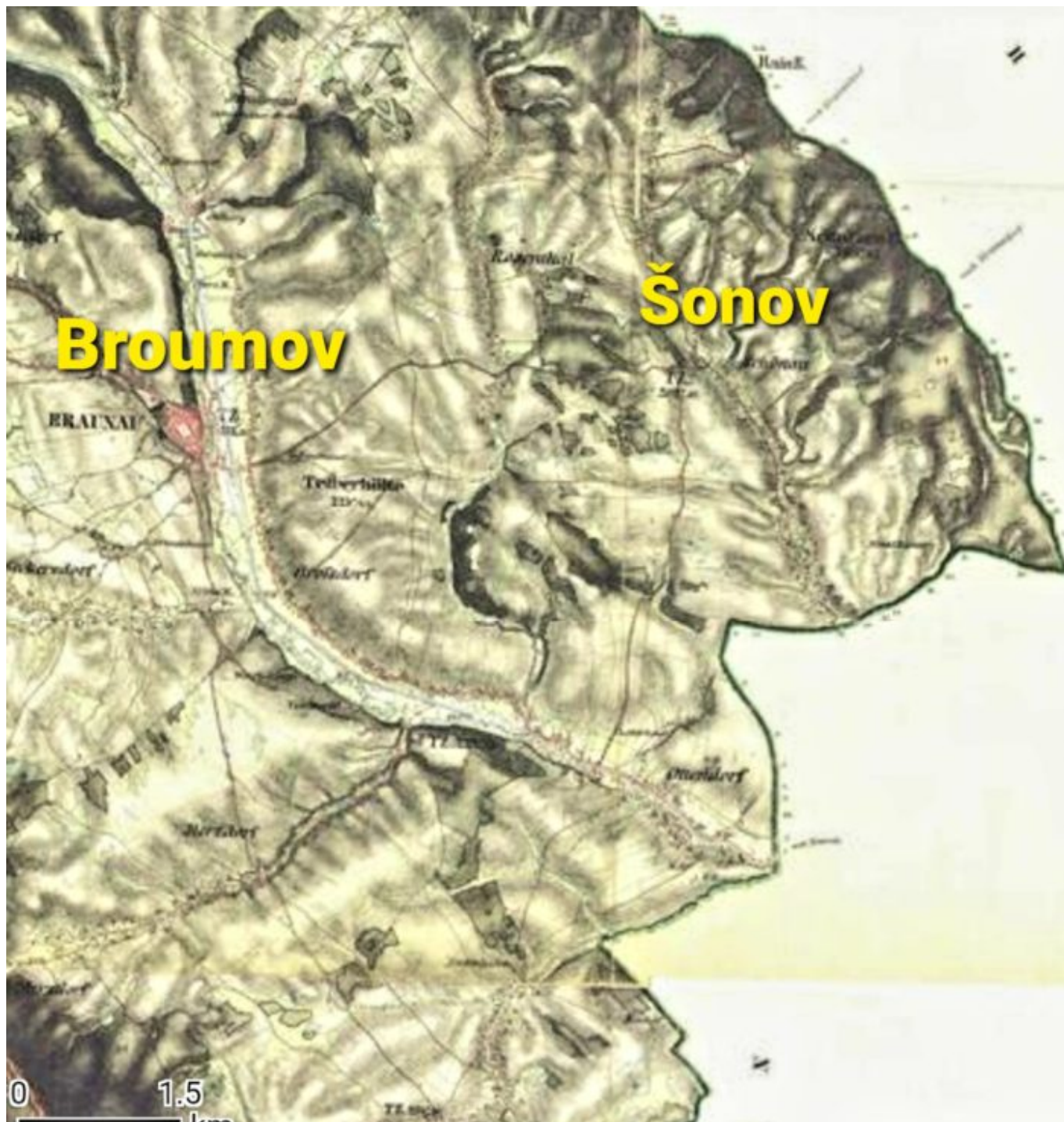
Místa misijního působení Magnuse Knappeho v Čechách

Baptisté v Broumově utrpěli odsunem německého obyvatelstva z pohraničí, kdy sbor téměř zanikl. Přesto je zde dodnes malá skupina českých baptistů.