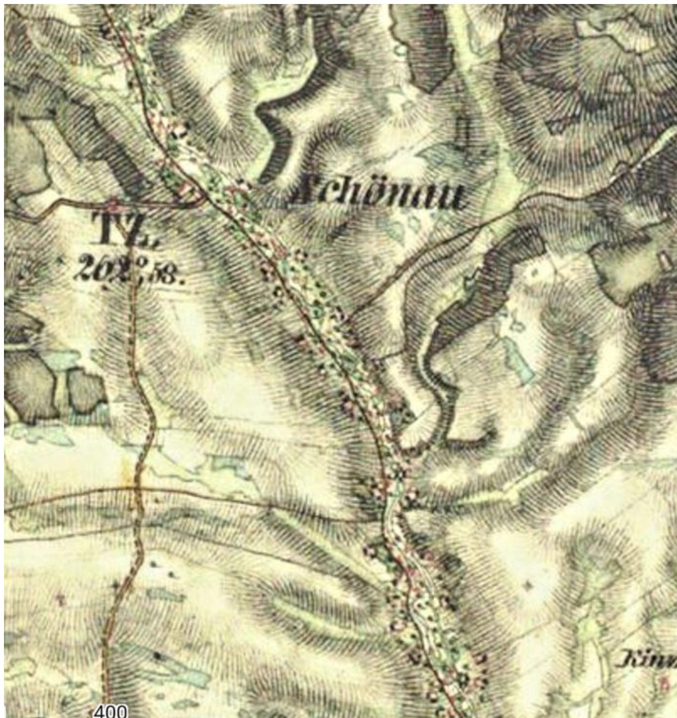
Šonov (Schönau) na dobové mapě

Magnus Knappe žil s Luisou Meyerovou dlouhá léta. Poté ovdověl a oženil se s Emilií Topfereovou, se kterou měl dalších pět dětí. Zemřel v požehnaných 88 letech 25. listopadu 1910.