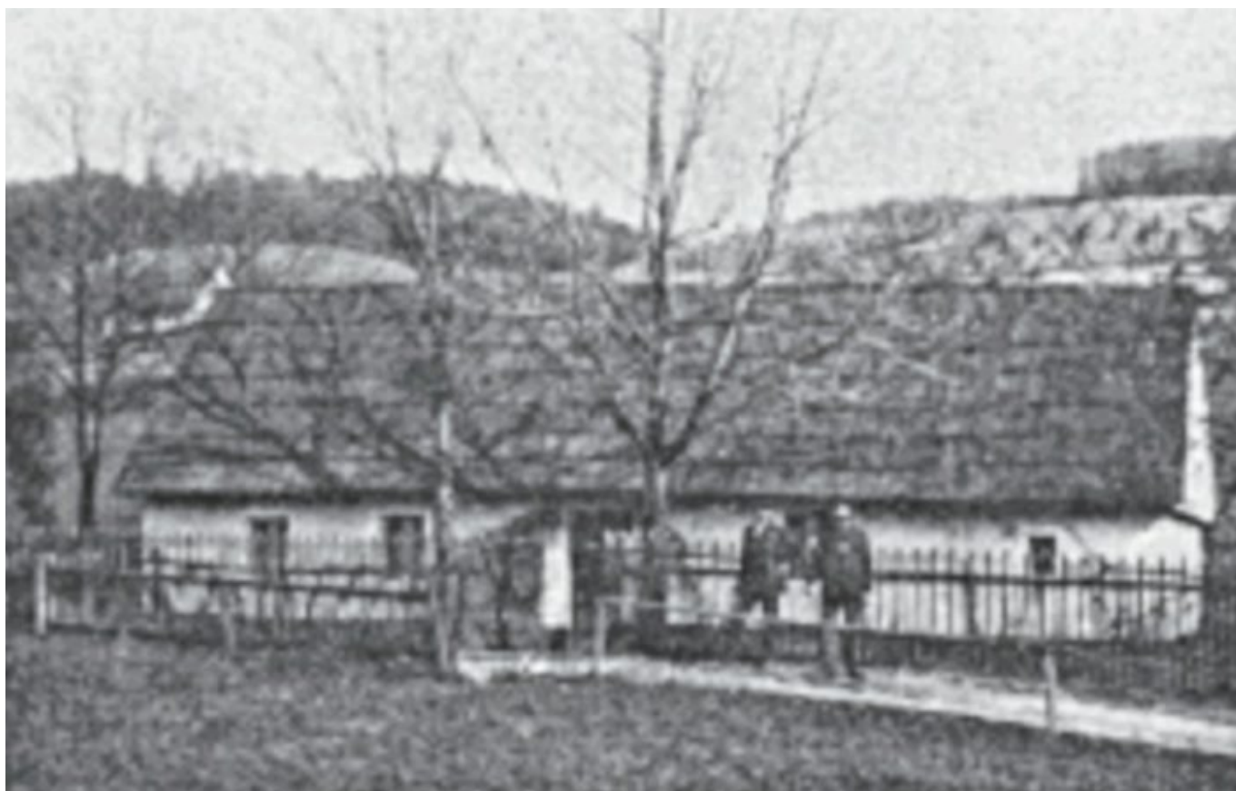
Knappeův dům ve Voigtsdorfu

Poznané evangelium šířil ve svém okolí, ale pro odpor místního faráře se v padesátých letech odstěhoval do Voigtsdorfu, centra baptistické misie v kladské oblasti. V červenci 1858 ho Pruský svaz německých baptistů ordinoval (ustanovil) za misionáře pro Horní Slezsko.