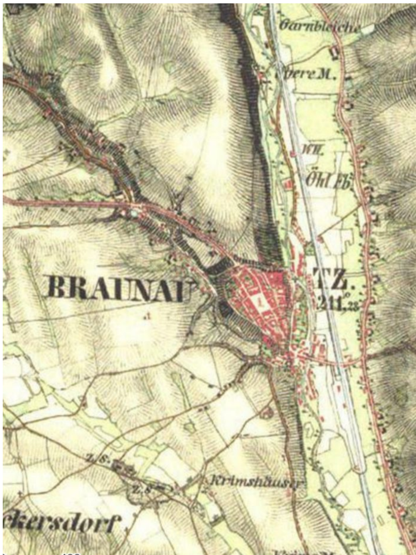
166 Broumov na dobové mapě