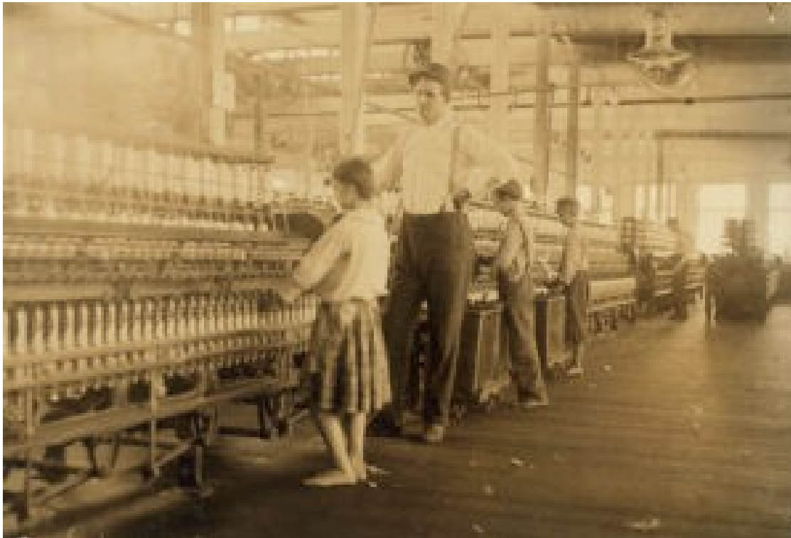
Dozorce dohlížející na dívku (asi 13 letou) obsluhující stroj na navíjení cívek v Yazoo City Yarn Mills, Mississippi, fotografie Lewis W. Hine, 1911; v Library of Congress, Washington, DC

Klasická definice však pochází od účastníka samotného hnutí, teologa Shailera Mathewse, který sociální evangelium označil za „aplikaci Ježíšova učení a úplné poselství křesťanské spásy společnosti, hospodářskému životu a společenským institucím ... stejně jako jednotlivcům.“