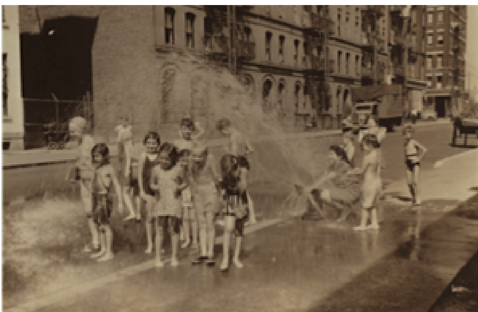
Děti z New Yorku se ochlazují ve vodotrysku z hydrantu. (datum neznámé)

Trvali na tom, že křesťané se musí přímo a v křesťanských termínech zabývat novými skutečnostmi městského průmyslového života. ... Našli výmluvný hlas ve Walteru Rauschenbuschovi ... (který) přeměnil biblickou myšlenku království Božího ve vizi progresivní křesťanské přeměny Ameriky v kooperativní křesťanskou společnost.