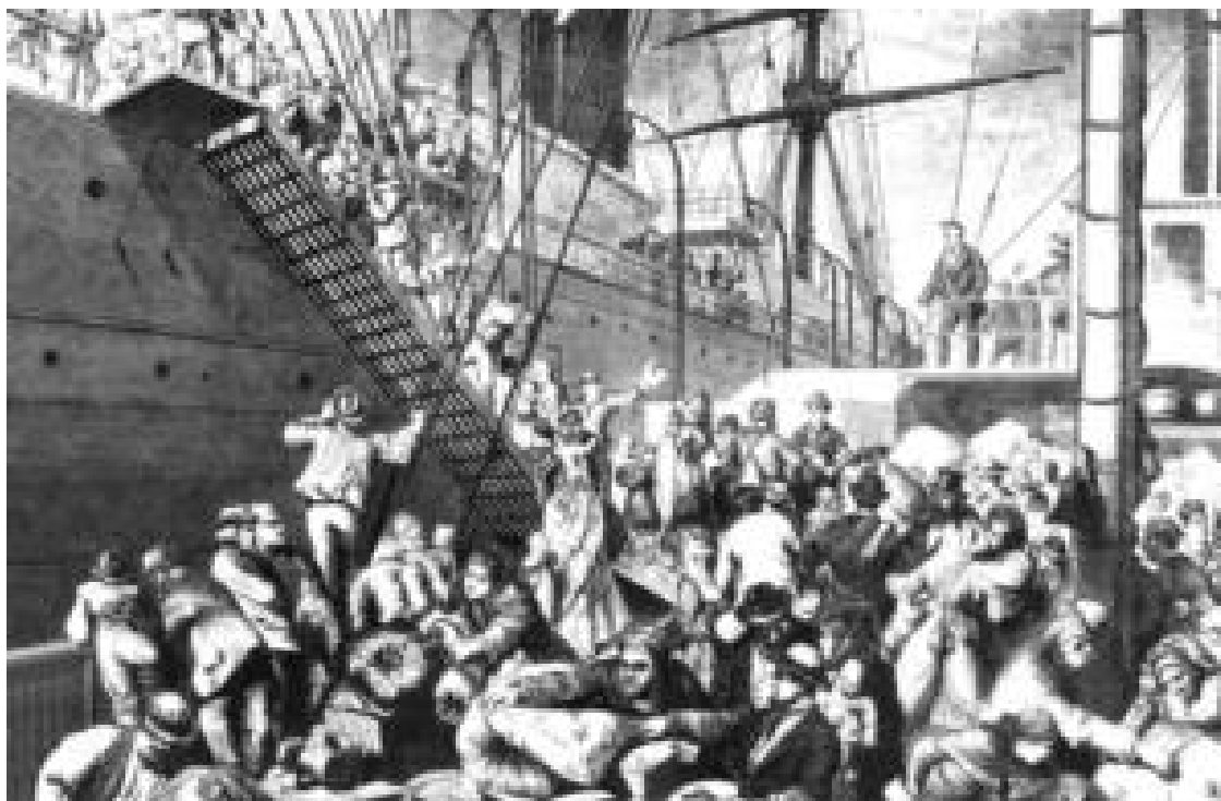
Týdeník Harper's Weekly - karikatura německých emigrantů nastupujících na parník v Hamburku, Německo, 1874.

Ale jak poznamenali mnozí z jeho životopisců, v roce 1886 se Walter stal jiným druhem misionáře, jako 25letý kazatel Druhého německého baptistického sboru v New Yorku, malé kongregaci nacházející se na okraji slumu zvaného „Pekelná Kuchyně“ („Hell's Kitchen“). Podle Evanse to byla služba 143 německým baptistům z dělnické třídy za 600 dolarů ročně, „ kteřá měla největší vliv na utváření (Rauschenbuschovy) teologie a jeho orientaci na sociální reformy. “