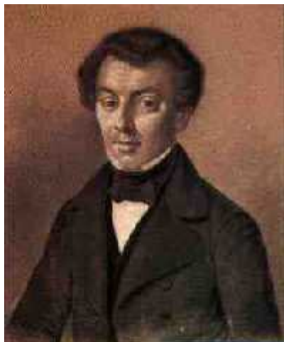
Johann Gerhard Oncken

Oncken převzal tuto myšlenku z Anglie, kde byl před několika lety činný jako obchodník.