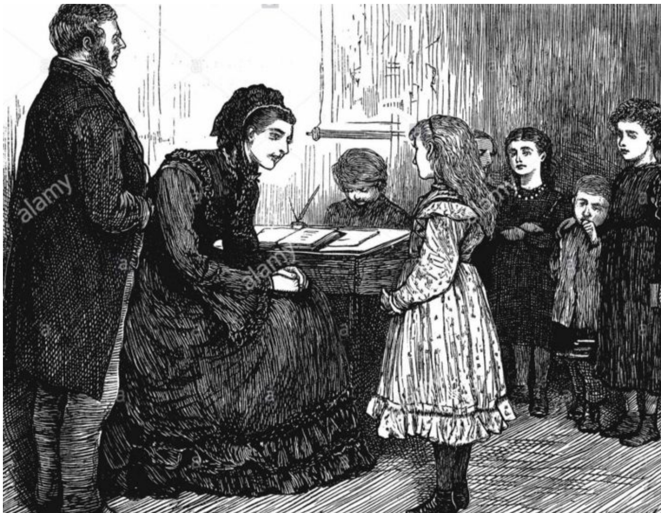
Raikesova nedělní škola

Dobový evangelický tisk popisuje vznik Raikesovy nedělní škola takto: