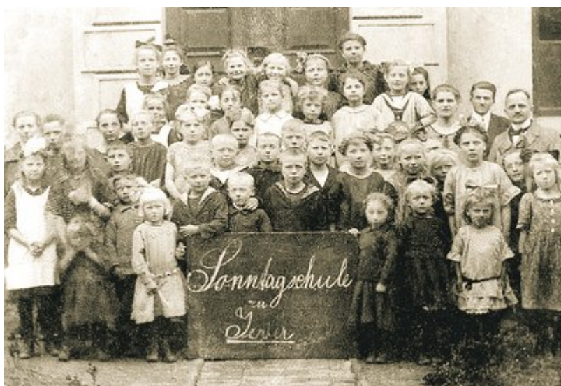
Nedělní škola v roce 1920

V Německu již 9. prosince 1790 vyzvalo Hamburgské kolegium pro chudé svým oběžníkem pro „pány, pečující o chudé“ zřízení večerní a nedělní školy pro chudé děti, „které kvůli žebrání chleba nemohou navštěvovat školu,“. Bylo plánováno, že děti se budou vyučovat čtení, náboženství, psaní a počítání každý večer od 5 do 8 hodin a v neděli od 11 do 12 hodin, nebo od 2 do 4 hodin. Zda večerní a nedělní škola opravdu začala svoji činnost není z dostupných pramenů jasné.