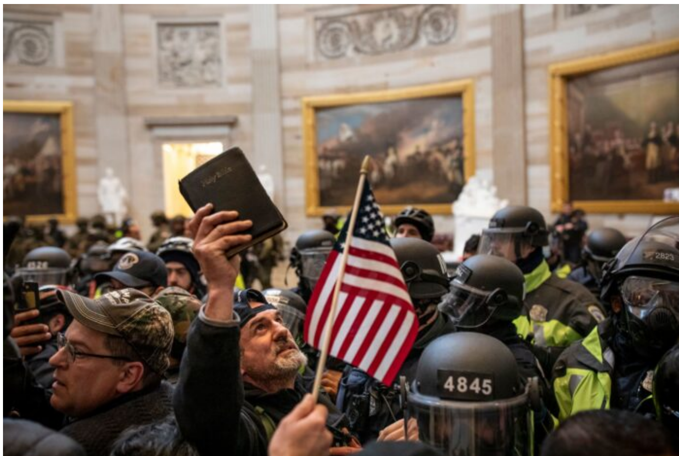
Evangelikálové na křížové výpravě v Kongresu.

například moderní vědu a historický výzkum. Ve volební místnosti se bojuje proti demokratům, kteří ohrožují naši demokracii. Jižní hranice je přední linií, která brání vstupu bezbožných hord, jež by se mohly stát demokraty, pokud by jim bylo umožněno stát se občany USA.