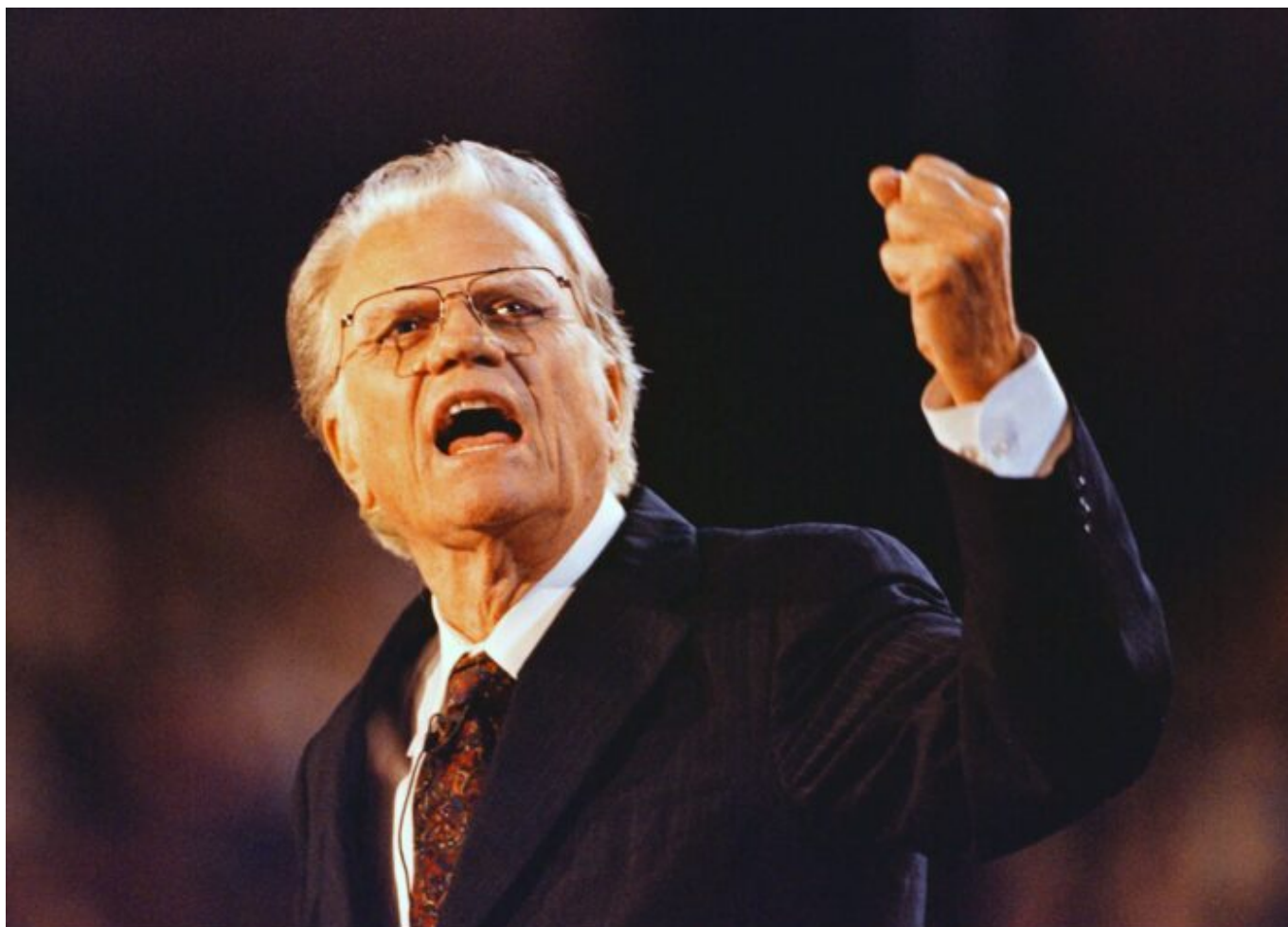
Billy Graham na křížové výpravě