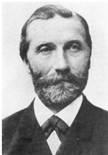
Johann Gerhard Oncken

Jednalo se o německé sbory a na jejich založení měl zásadní vliv Johann Gerhard Oncken, který zakládal baptistické hnutí v Evropě mimo Britské ostrovy.