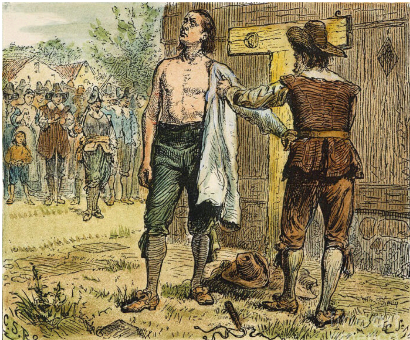
Obadiah Holmes je bičován v Bostonu

Když dnes slyšíme novokalvinisty, jak zlostně zatracují a odsuzují biblicky zdůvodněnou, Božím povoláním potvrzenou a Duchem svatým posvěcenou kazatelskou službu baptistických žen, připomeňme si, že před více než čtyřmi sty lety odsoudili tehdejší puritánští kalvinisté k trestu smrti baptistu O. Holmese za “odmítnutí spásné moci křtu nemluvnat, což z něho učinilo vraha duše” , tedy za biblicky zdůvodněný, Božím povoláním potvrzený a Duchem svatým posvěcený křest dospělých věřících. Historie se opakuje.