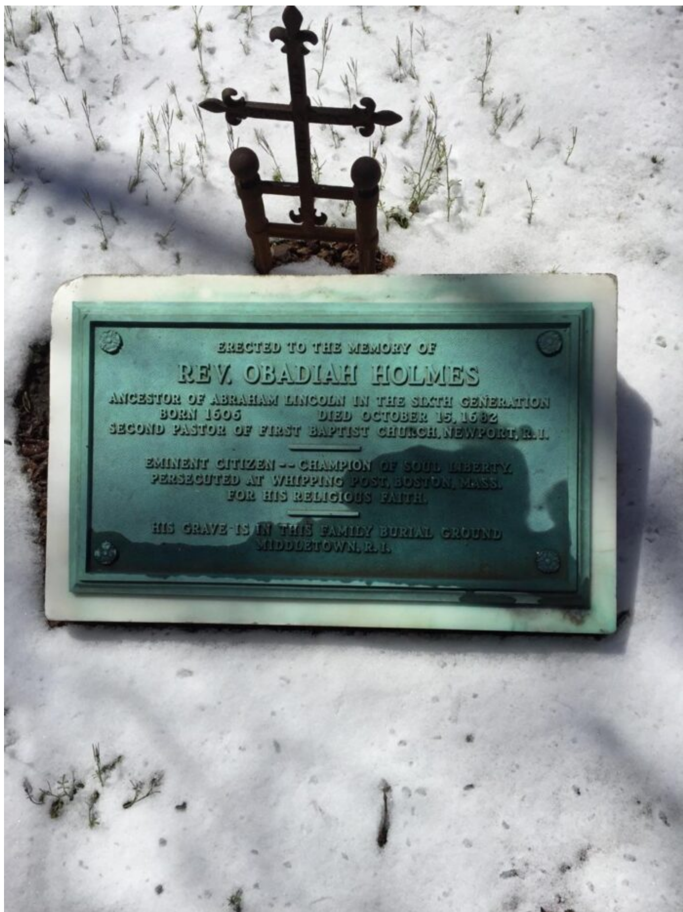
Náhrobní deska Obadiah Holmese