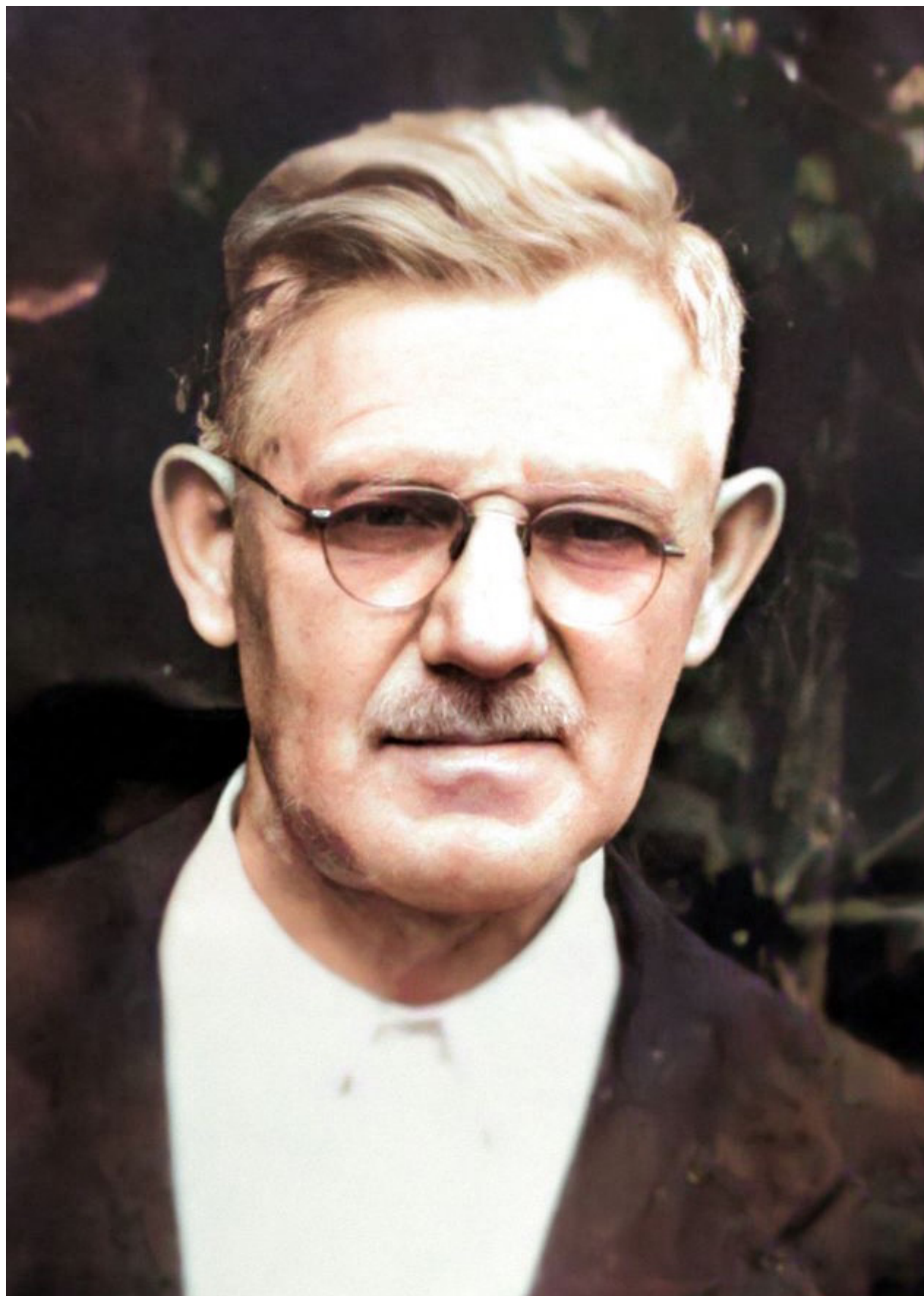
Jenő Béla Stumpf