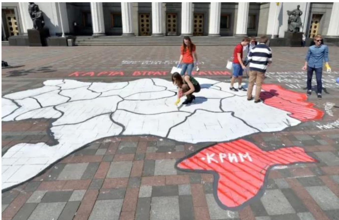
„Mapa ukrajinských ztrát“ namalovaná před budovou kyjevského parlamentu v roce 2014, zobrazující (červeně) území okupovaná Ruskem: Krym na jihu a Doněck a Luhansk na východě.