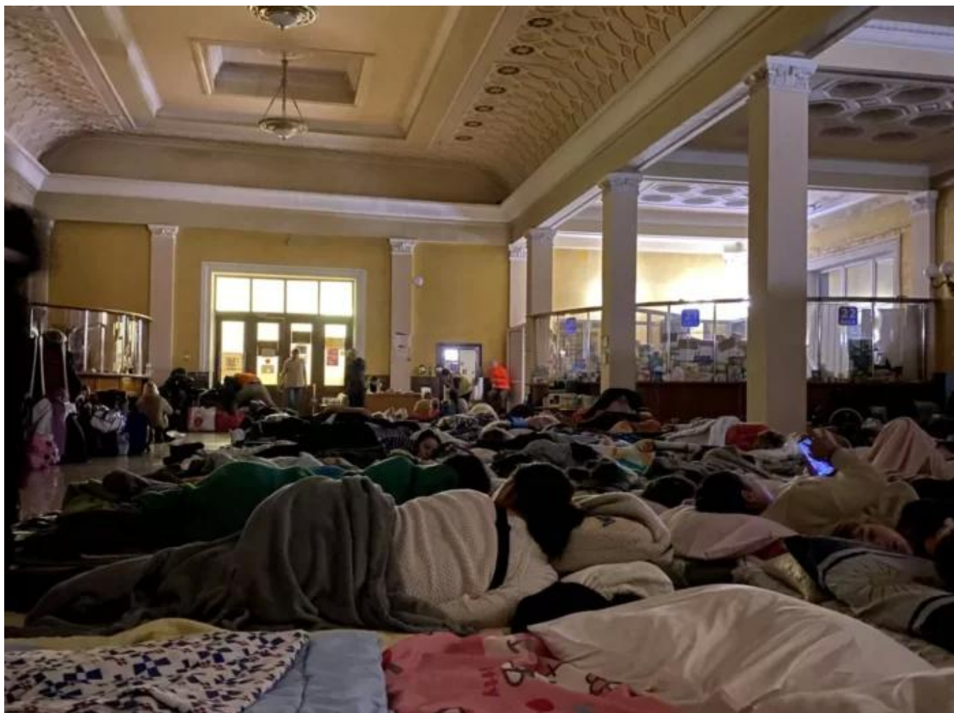
Ženy s dětmi přespávají na Lvovském nádraží 22. března 2022.