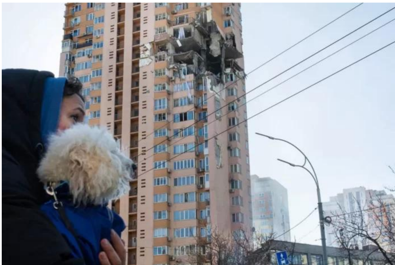
Žena nese svého psa kolem činžovního domu poškozeného ranním ostřelováním v Kyjevě na Ukrajině 26. února 2022.