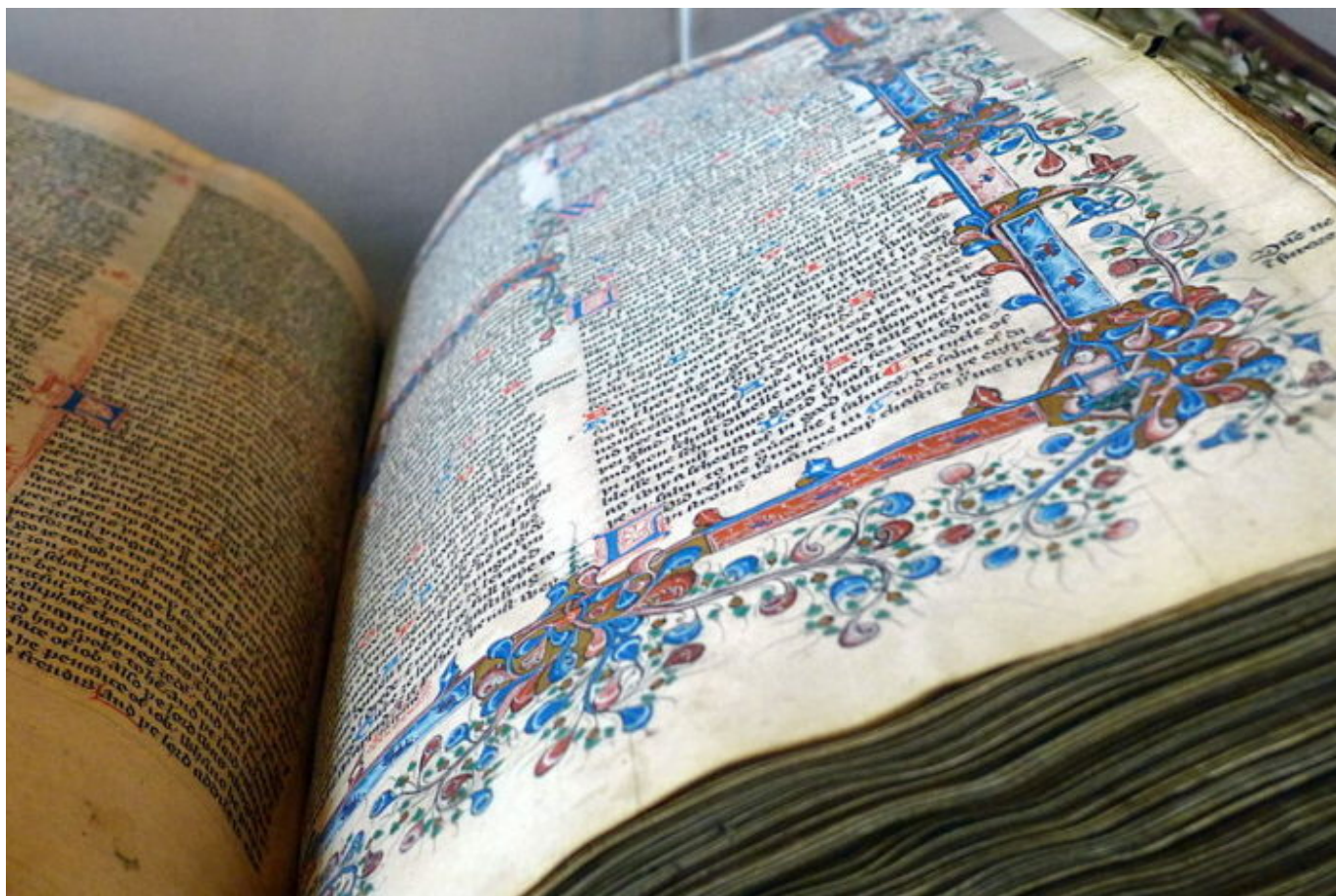
Bible Williama Tyndala

Zveřejnění anglického Nového zákona Williama Tyndala v roce 1526 pomohlo šířit protestantské myšlenky. Tyndaleova Bible, vytištěná v zahraničí a propašovaná do země, byla první anglickou Biblí, která byla hromadně vyráběna; do roku 1536 bylo v Anglii pravděpodobně 16 000 výtisků. Tyndaleův překlad byl velmi vlivný a tvořil základ všech pozdějších anglických překladů. V útoku na tradiční náboženství zahrnoval Tyndaleův překlad epilog vysvětlující Lutherovu teologii ospravedlnění vírou, a mnoho jeho překladů v textu bylo napsáno tak, aby podkopalo tradiční katolické učení. Tyndale například přeložil řecké slovo charis raději jako laskavost než milost , aby oslabil roli milosti v poskytovaných svátostí. Jeho volba lásky nikoli charity při překladu agape oslabila dobré skutky. Při vykreslování řeckého slovesa metanoieit do angličtiny používal Tyndale raději lítostné pokání ( repent ) než útrpné pokání ( penance ). První slovo naznačovalo vnitřní obracení se k Bohu, zatímco druhý překlad by podporoval svátost vyznání.