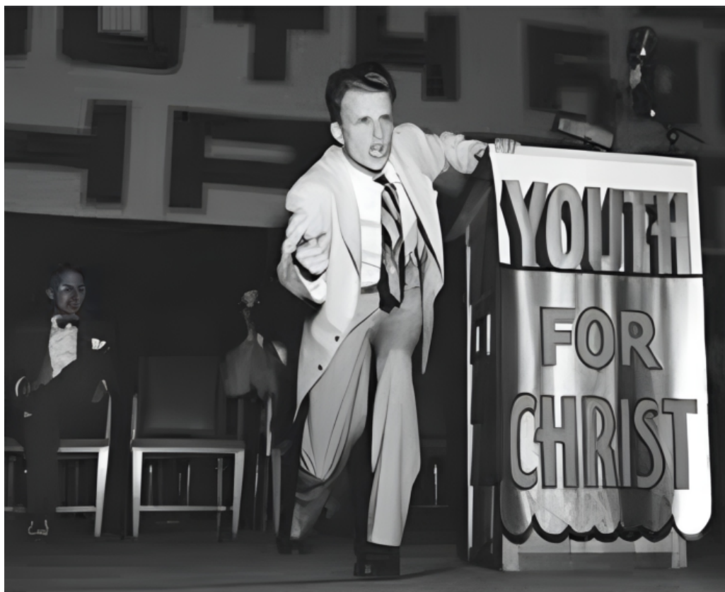
Billy Graham v době svého působení v organizaci Youth for Christ

Byl srpen 1949 a Billy Graham nikdy nebyl tak sklíčený. Dvanáct let poté, co se „oddal kázání“ na golfovém hřišti na Floridě, se evangelista potýkal s pochybnostmi. Četl neortodoxní teology, jako byli Karl Barth a Reinhold Niebuhr, kritiky liberální teologie, kteří otevřeně přiznávali, že Bible je plná chyb a vnitřních rozporů.