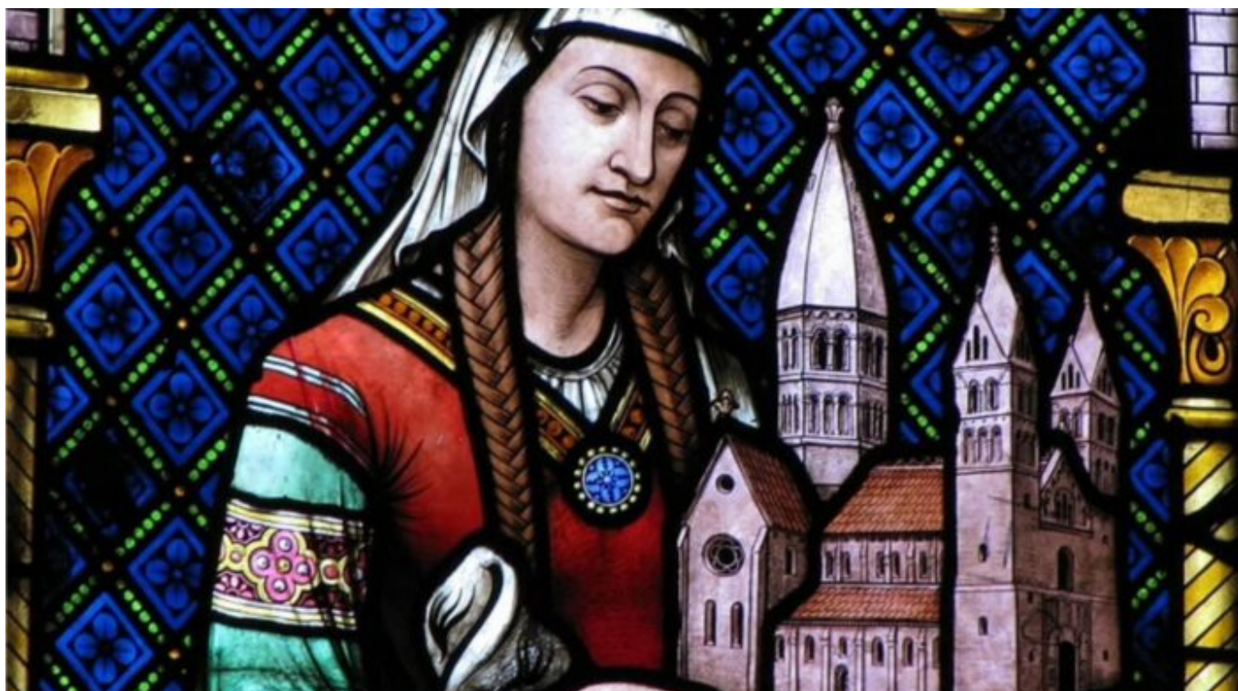
Ženy ve službě: Hildegard Bingenová

"Hildegard pravidelně kázala v Německu, podnikla čtyři kazatelské cesty mezi lety 1158 a 1170." (str. 89)