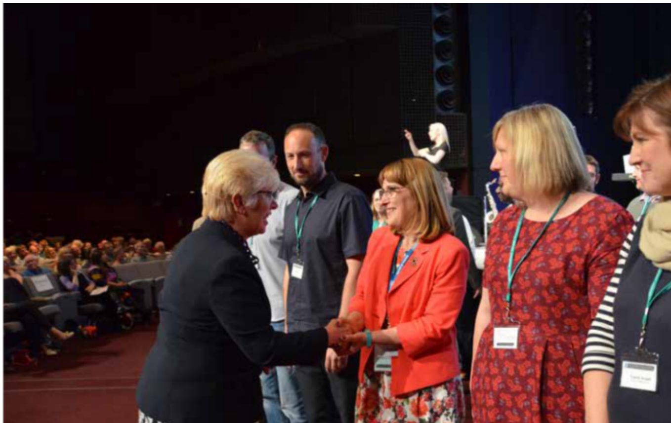
Dianne Tidballová, prezidentka Baptist Union v Anglii, zdraví plně akreditované kazatelky na sjezdu anglických baptistů v roce 2017