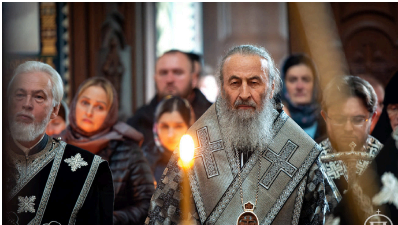
METROPOLITA ONUPHRIUS BĚHEM BOHOSLUŽBY.

Metropolita Ukrajinske ortodoxní církve Moskevského patriarchátu (UOC-MP) Onufrij navrhuje uspořádat modlitební průvod do Mariupolu, aby duchovní mohli zajistit evakuaci civilistů a raněných z bunkrů Azovstal.