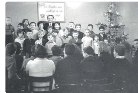
Ve staré modlitebně u nádraží bylo těсно.

„Zdá se, že jsme lidem každým větrem se klátícím. Mnohé události, které minuly rok