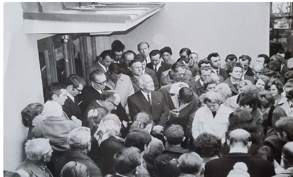
Otevření nové modlitebny 20. října 1972

Novotou vonící modlitebnou se rozlehl první písň: „Ať zní Bohu sláva“, „Ó šťastný den“, „Jak jsou milé příbytky Tvé“... Srdce všech přítomných byla naplněna radostí a vděčností. Atmosféru onoho slavnostního dne nejlépe vysti-