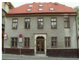
Sborový dům v současné době.