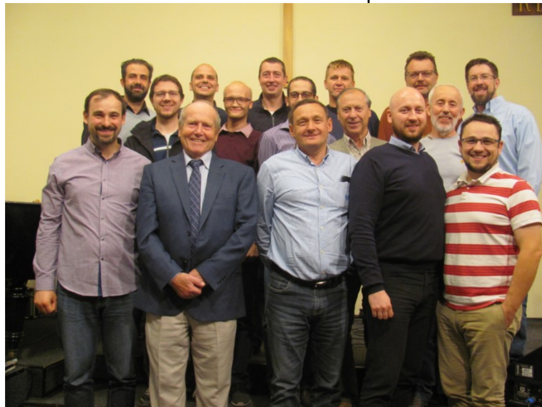
Společné foto kazatelů a starších pěti sborů, kteří se rozhodli odejít z BJB

Od té doby uplynulo několik měsíců a je ti-cho po pěšině. I v našem sboru se ozývají hlasy, jak to tedy je? Nikdo nic neví, co se s těmi sbory děje. Ozývají se otázky, na které nejsou odpovědi. Výkonný výbor BJB mlčí. Náš kazatel nic neví, staršovstvo také ne. Mlčí i sbory, které z BJB svým veřejným prohlášením vystoupily, a které ko-luje na internetu.