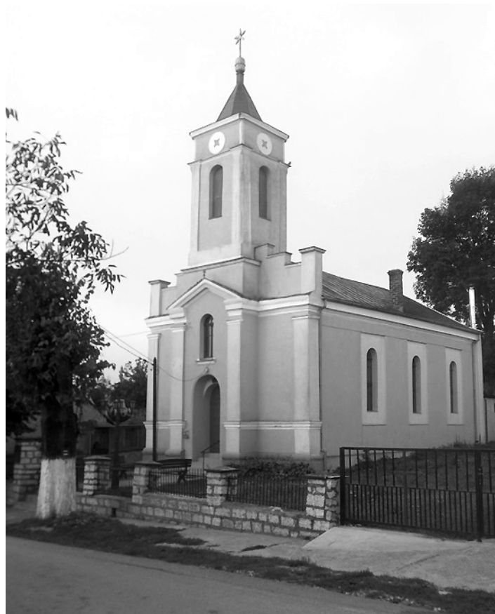
Evangelický kostel na Svaté Heleně z r. 1897

nekatolíci veřejně přihlásit po vydání tolerančního patentu 13. října 1781 Josefem II.