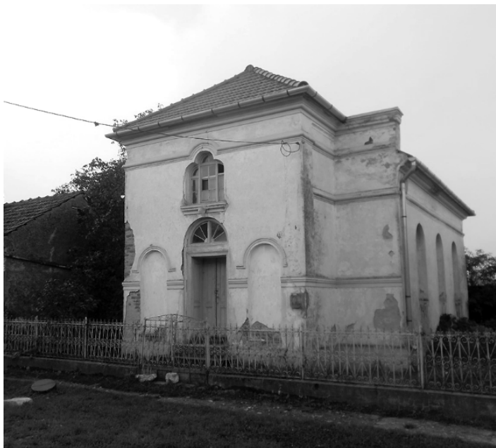
Baptistický kostel na Svaté Heleně z r. 1937

lenší baptisté české baptisty. Nalezli je v baptistickém sboru v Teplé a ve sboru v Praze na Vinohradech. Na začátku roku 1949 se stali kazatelskou stanicí pražského vinohradského sboru a za jejich velké podpory se mohli na konci roku 1949 stát i samostatným sborem Československých baptistů. Vstoupili tak do společenství, které mělo již svou dlouhou tradici a také důrazy svého vyznání, které souznivaly s důrazy baptistů na celém světě.